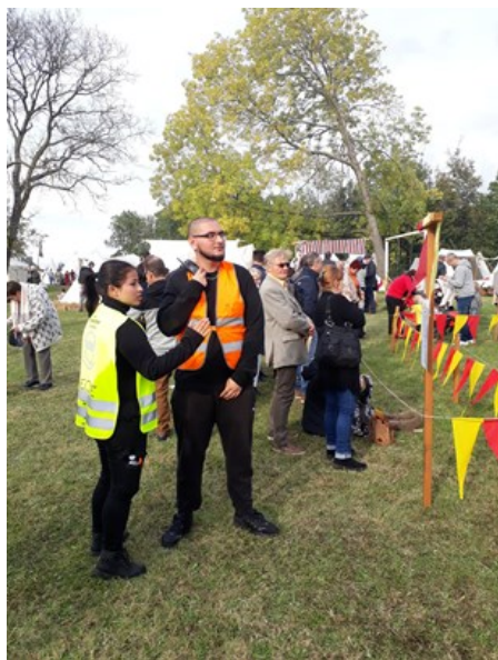
Commission Communautaire Française